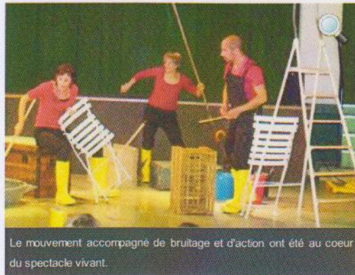
Le mouvement accompagné de bruitage et d'action ont été au coeur du spectacle vivant.

Publié le 25/09/2013 à 03:53, Mis à jour le 25/09/2013 à 08:08